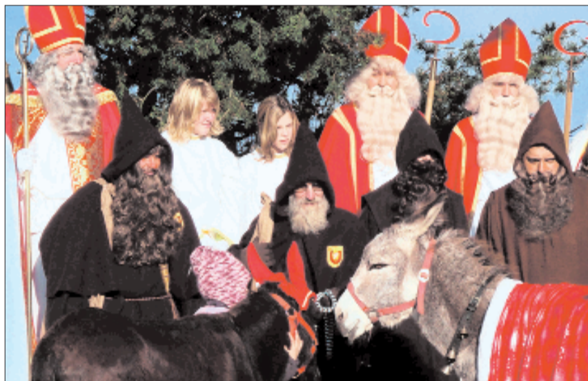
Esel, Schmutzli und Engel – die Embracher Nikoläuse hatten alles dabei. (mom)

Ausser in Embrach haben gestern weitere Chlausumzüge stattgefunden, so der grosse Umzug in Bülach und der etwas kleinere in Niederhasli.