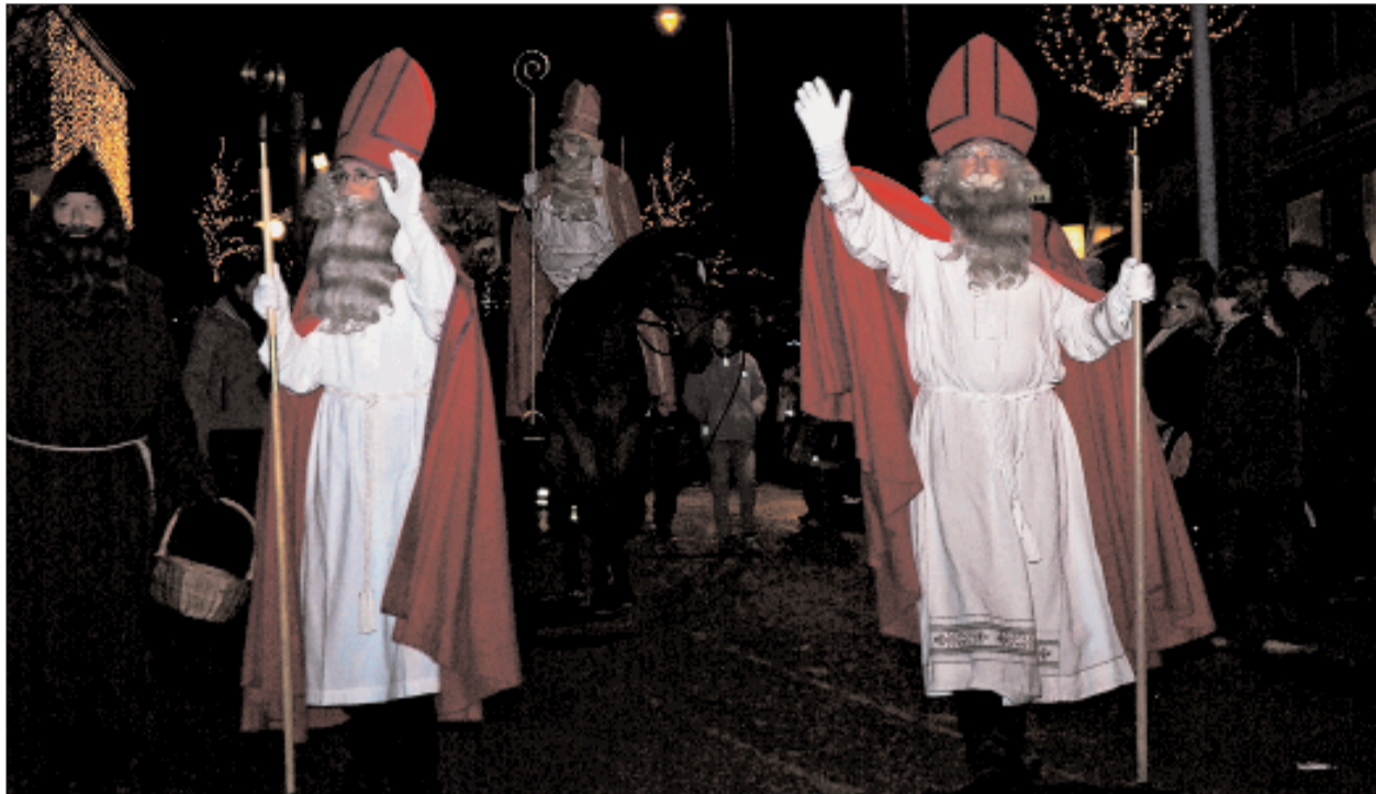
Die Nikoläuse in Bülach sind in der traditionellen St.-Nikolaus-Kutte unterwegs. Am Umzug nahmen solche aus verschiedenen Zürcher Ortschaften teil. Hier die Chläuse aus Volketswil. (Thierry Haecy)

Nicht nur in Embrach, auch in den umliegenden Gemeinden wurden die