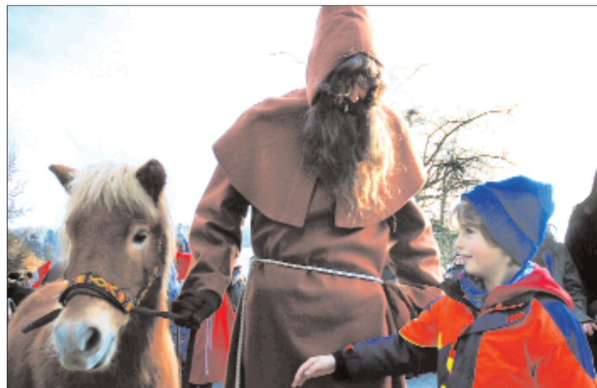
«Gfürchtig» wirkt Schmutzli in Niederhasli nicht – besonders das Pony lockt. (thy)

Wangen-Brüttisellen Musikalische Improvisationen und ihre Bilder